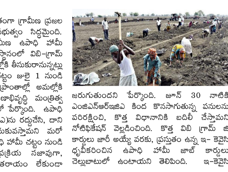
జరుగుతుందని పేర్కొంది. జూన్ 30 నాటికి ఎంజిఎన్ఆర్ఇజిఎ కింద కొనసాగుతున్న పనులను పరిరక్షించి, కొత్త విధానానికి బదిలీ చేస్తామని నోటిఫికేషన్ వెల్లడించింది. కొత్త విబి గ్రామ్ జి కార్డులు జారీ అయ్యే వరకు, ప్రస్తుతం ఉన్న ఇ-కెవైసి ధృవీకరించిన ఉపాధి హామీ జాబ్ కార్డులు చెల్లబాటులో ఉంటాయని తెలిపింది. ఇ-కెవైసి

న్యూఢిల్లీ మే11 (నేటి దర్శిని) విబి-గ్రామ్ జి చట్టాన్ని బలపఠంగా గ్రామీణ ప్రజల నెత్తిన రుద్దేందుకు మోడీ ప్రభుత్వం సిద్ధమైంది. మహాత్మాగాంధీ జాతీయ గ్రామీణ ఉపాధి హామీ చట్టాన్ని రద్దు చేసి.. ఆ చట్టం స్థానంలో విబి-గ్రామ్ జి చట్టాన్ని దేశవ్యాప్తంగా అమల్లోకి తీసుకురానున్నట్లు కేంద్రం ప్రకటించింది. ఈ చట్టం జులై 1 నుండి అన్ని రాష్ట్రాలూ, కేంద్రపాలిత ప్రాంతాల్లో అమల్లోకి రానుందని సోమవారం గ్రామీణాభివృద్ధి మంత్రిత్వ శాఖ జారీ చేసిన నోటిఫికేషన్ లో పేర్కొంది. ఉపాధి హామీ చట్టం (ఎంజిఎన్ఆర్ ఇజిఎ)ను రద్దుచేసి, దాని స్థానంలో కొత్త చట్టాన్ని తీసుకువస్తామని మరో నోటిఫికేషన్ లో తెలిపింది. ఉపాధి హామీ చట్టం నుండి కొత్త విధానానికి మారే ప్రక్రియ నజాపుగా, కార్మికులకు ఎటువంటి అంతరాయం లేకుండా