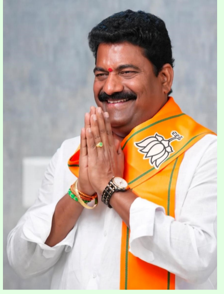
మిడ్చిల్, మే 14, (నేటి దర్శిని మహబూబ్ నగర్ జిల్లా బ్యారో):

రైతు సంక్షేమమే లక్ష్యంగా కేంద్రంలోని ప్రధాని నరేంద్ర మోడీ సర్కార్ పనిచేస్తున్నారని బిజెపి రాష్ట్ర నాయకులు ముచ్చర్ల జనార్దన్ రెడ్డి ఒక ప్రకటనలో పేర్కొన్నారు. బుధవారం జరిగిన కేంద్ర కేబినెట్ లో మరోసారి పంటలకు మద్దతు ధర పెంచి నిర్ణయం తీసుకోవడం హర్షదాయకమని అన్నారు. మద్దతు ధర పెంపుతో రైతులకు ఎంతో మేలు జరుగుతుందన్నారు. రైతు పండించిన పంటకు లాభదాయకమైన గిట్టుబాటు ధరను అందించడమే కాకుండా రైతు ఆదాయ భద్రతను పటిష్టం చేస్తుందని అన్నారు. దేశ వ్యవసాయ రంగాన్ని మరింత బలోపేతం చేస్తుందన్నారు. రైతు సంక్షేమానికి కేంద్ర కేబినెట్ తీసుకున్న నిర్ణయం చారిత్రాత్మకమని అన్నారు. కేంద్ర ప్రభుత్వానికి ప్రధాని నరేంద్రమోడీ కి కృతజ్ఞతలు తెలిపారు.