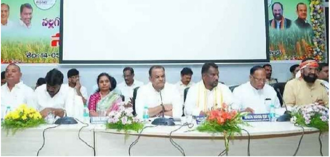
నల్లగొండ, మే 14 (నేటి దర్శిని):