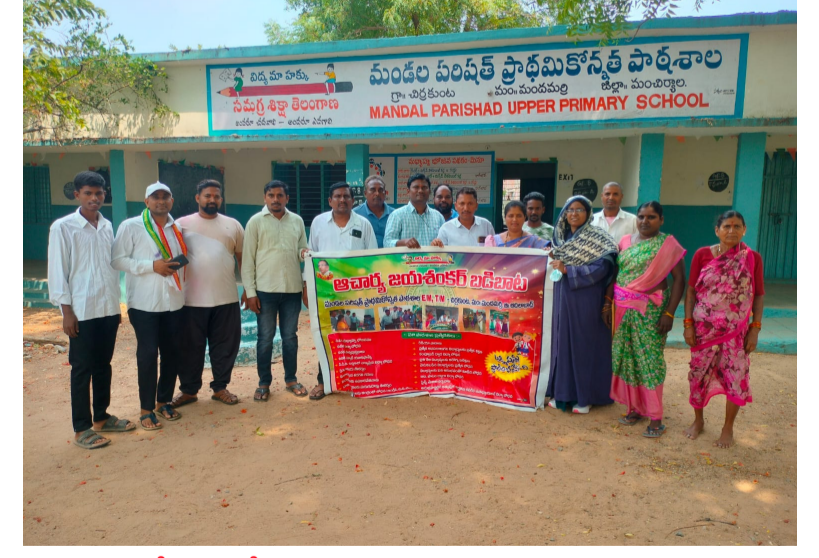
మందమర్రి మే 14: (నేటి దర్శిని):