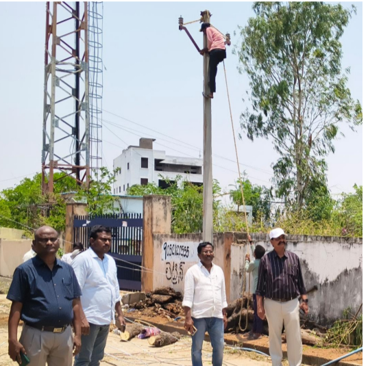
పరిశీలిస్తూ, దెబ్బతిన్న లైన్ల మరమ్మత్తు పనులను వేగవంతం చేయాలని ఉన్నతాధికారులు సిబ్బందికి ఆదేశాలు జారీ చేశారు. ముఖ్యంగా వ్యవసాయ బోర్డు,

మిడ్డెల్ మే 25 (నేటి దర్శిని ప్రతినిధి): మిడ్డెల్ మండల కేంద్రంలో ఇటీవల భారీ వర్షాలు, ఈదురుగాలుల ప్రభావంతో పలుచోట్ల విద్యుత్ స్తంభాలు విరిగిపడటంతో విద్యుత్ సరఫరా అంతరాయం ఏర్పడింది. ఈ పరిస్థితిని వెంటనే గుర్తించిన విద్యుత్ శాఖ అధికారులు ప్రజలు, రైతులకు ఎలాంటి ఇబ్బందులు కలగకుండా ప్రత్యేక చర్యలు చేపట్టి యుద్ధ ప్రాతిపదికన పునరుద్ధరణ పనులు కొనసాగిస్తున్నారు. విరిగిపడిన విద్యుత్ స్తంభాలను