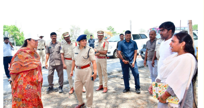
వరి ధాన్యాన్ని పరిశీలిస్తున్న జిల్లా కలెక్టర్, జిల్లా ఎస్సీ